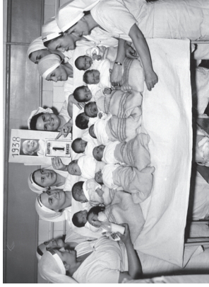
Sages-femmes et des nouveau-nés, le 1 er janvier 1938.