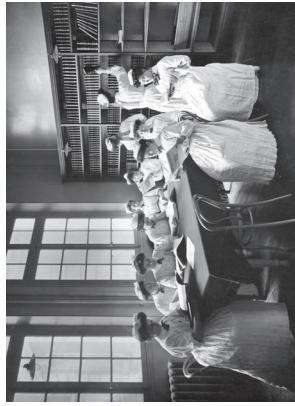
Élèves dans la bibliothèque, école d'infirmières, hôpital Salpêtrière, vers 1909.